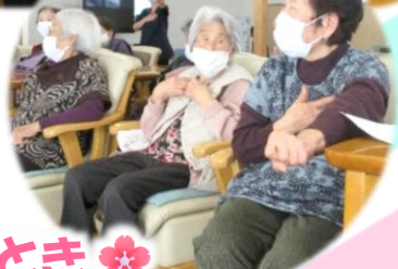
❀ 舞い・歌、盛沢山の楽しいひととき ❀