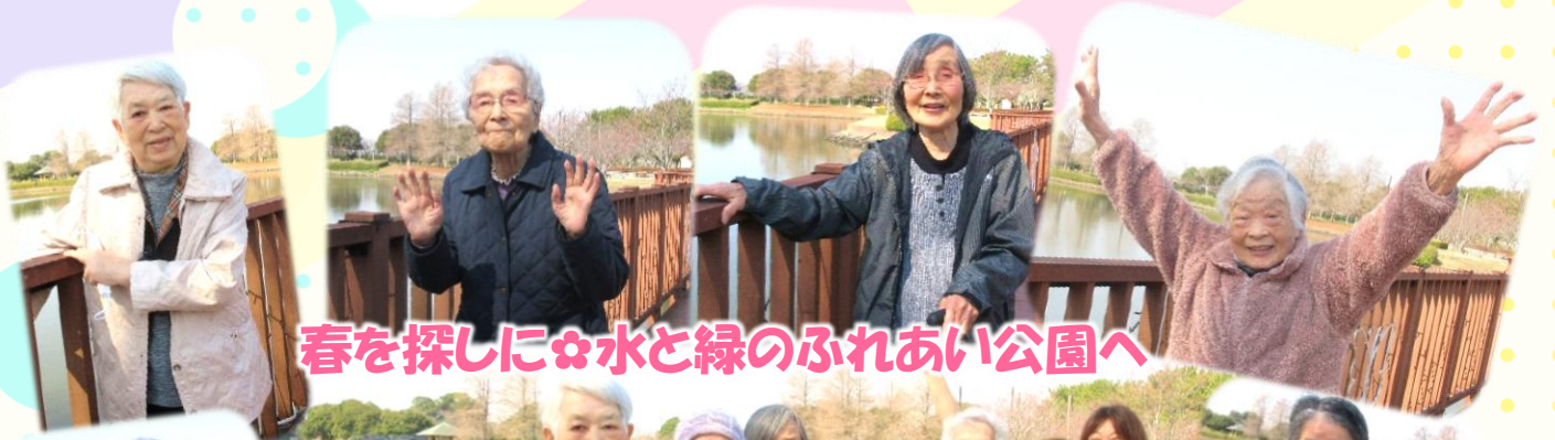
春を探しに❀水と緑のふれあい公園へ