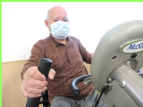
お楽しみの時間です