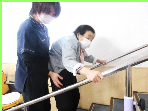
いつまでも自分の足で